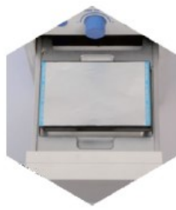
Step.3-1 Put a sealing film