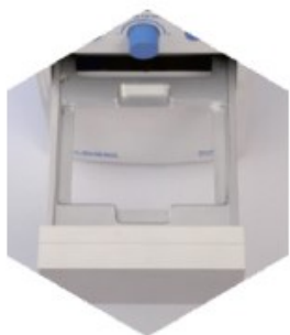
Step.1 Pull the drawer