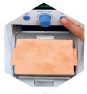
Step.4 Press "RUN"