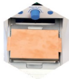
Step.3-2 Put the weighted seal platen if the film is curly