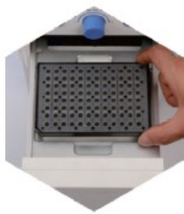
Step.2 Put the adapter plate